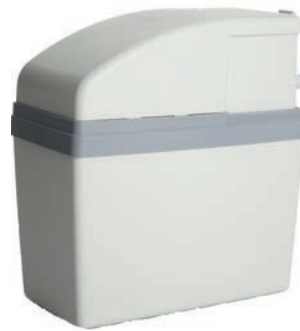
WatMan Delta Escalda