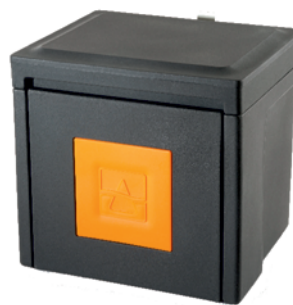
WatMan Delta Morava